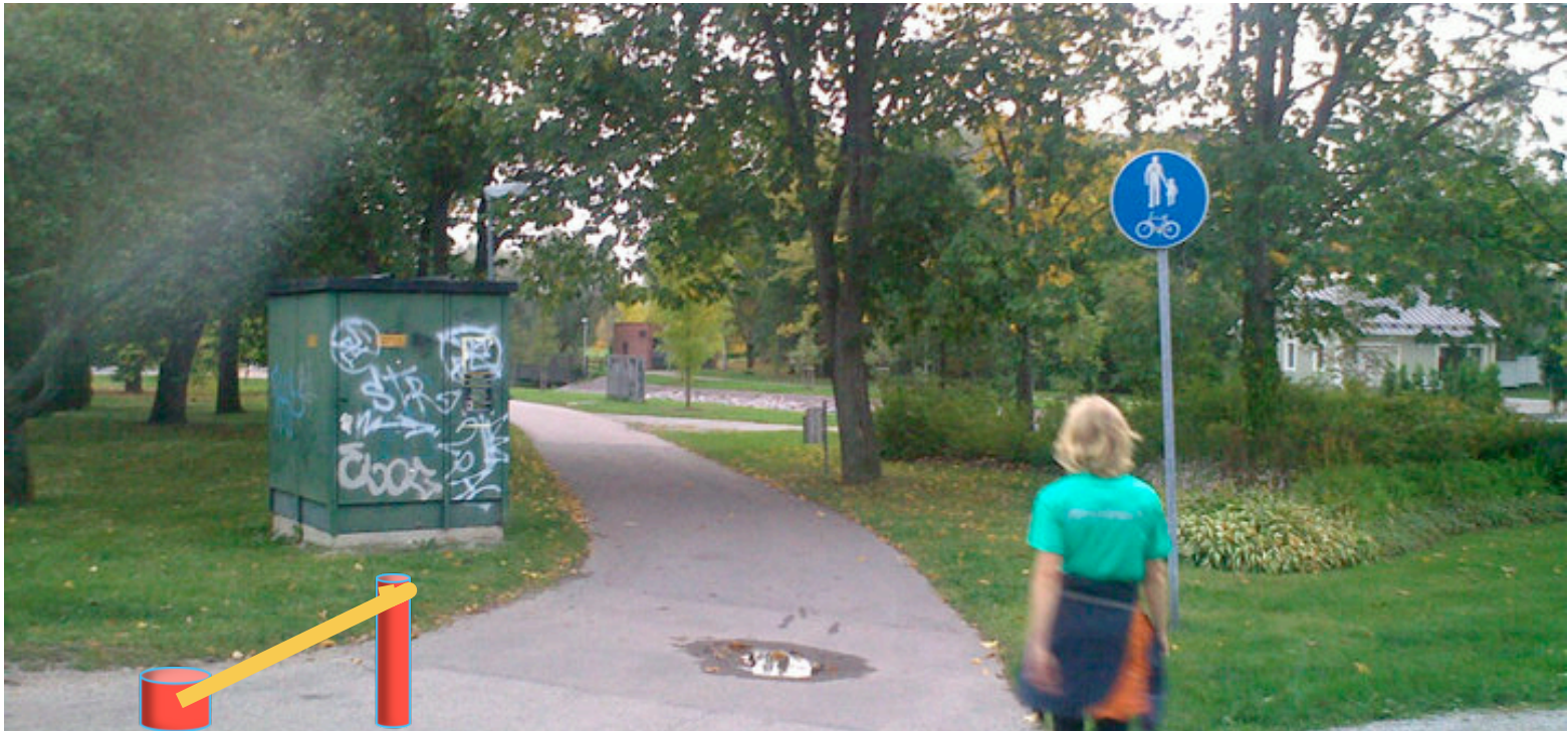
Aurora Ylönen, Sonja Poutanen